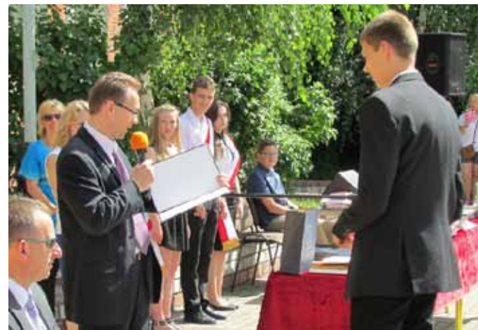
Publiczne Gimnazjum nr 2 w Zespole Szkół Ogólnokształcących w Nowogardzie