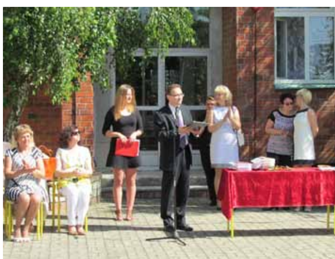
II Liceum Ogólnokształcące w Zespole Szkół Ogólnokształcących w Nowogardzie