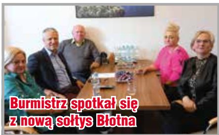
Burmistrz spotkał się z nową sołtys Błotna