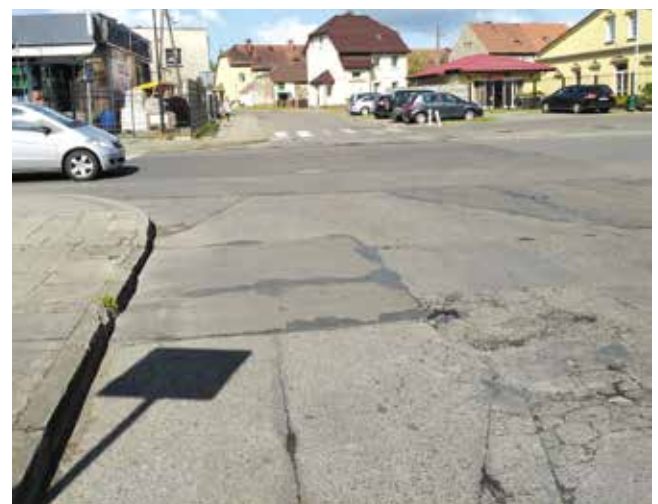
Ulica Żeromskiego przed remontem