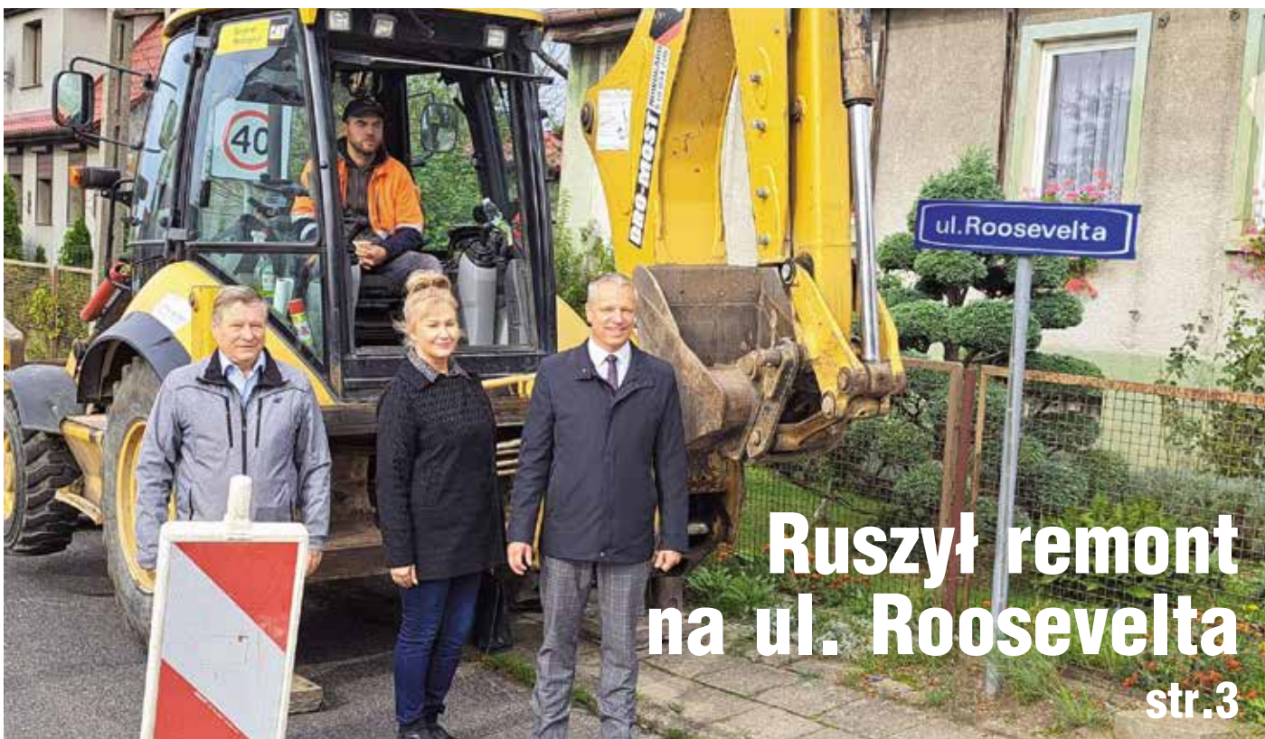
Ruszył remont na ul. Roosevelta str.3