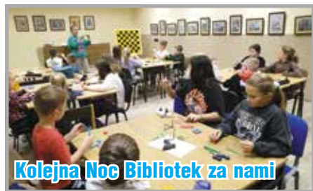
Kolejna Noc Bibliotek za nami