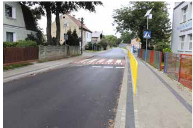
Część ul. Żeromskiego po remoncie

uchwałą, aby w końcu inwestycja mogła być zrealizowana.