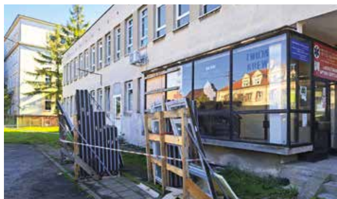
Praca w szpitalu wre. Termomodernizacja starych budynków ruszyła na dobre str.2