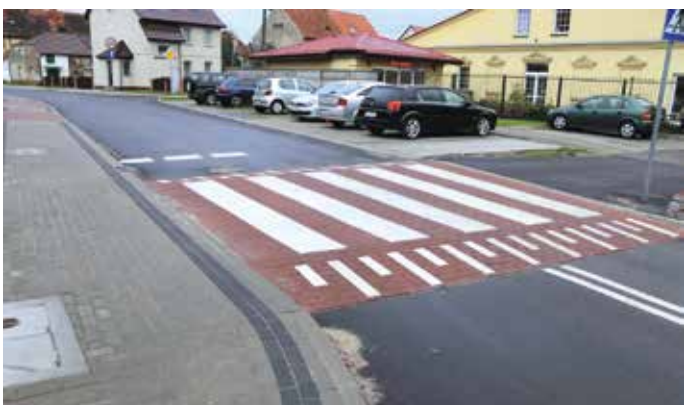
W trosce o wydawanie publicznych pieniędzy