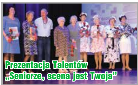
Prezentacja Talentów „Seniorze, scena jest Twoja”