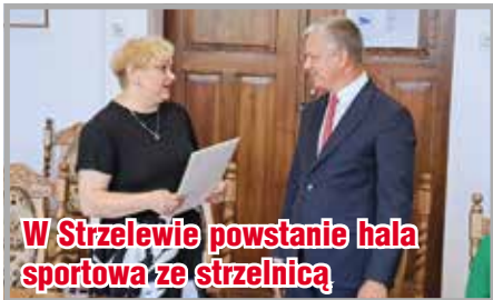
W Strzelewie powstanie hala sportowa ze strzelnicą