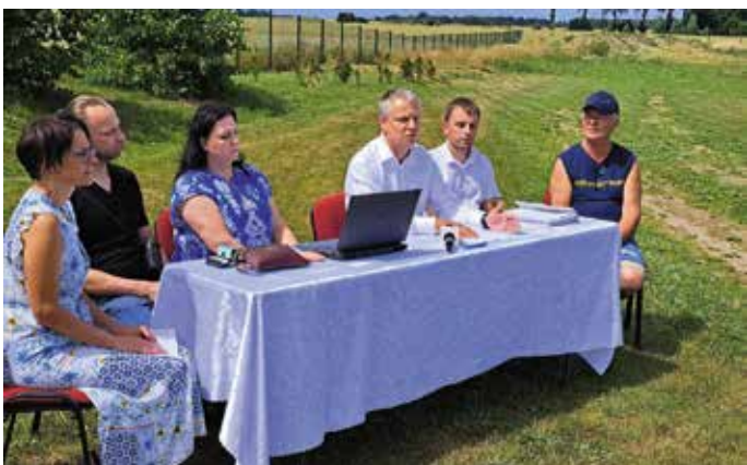
W Żabowie powstanie świetlica