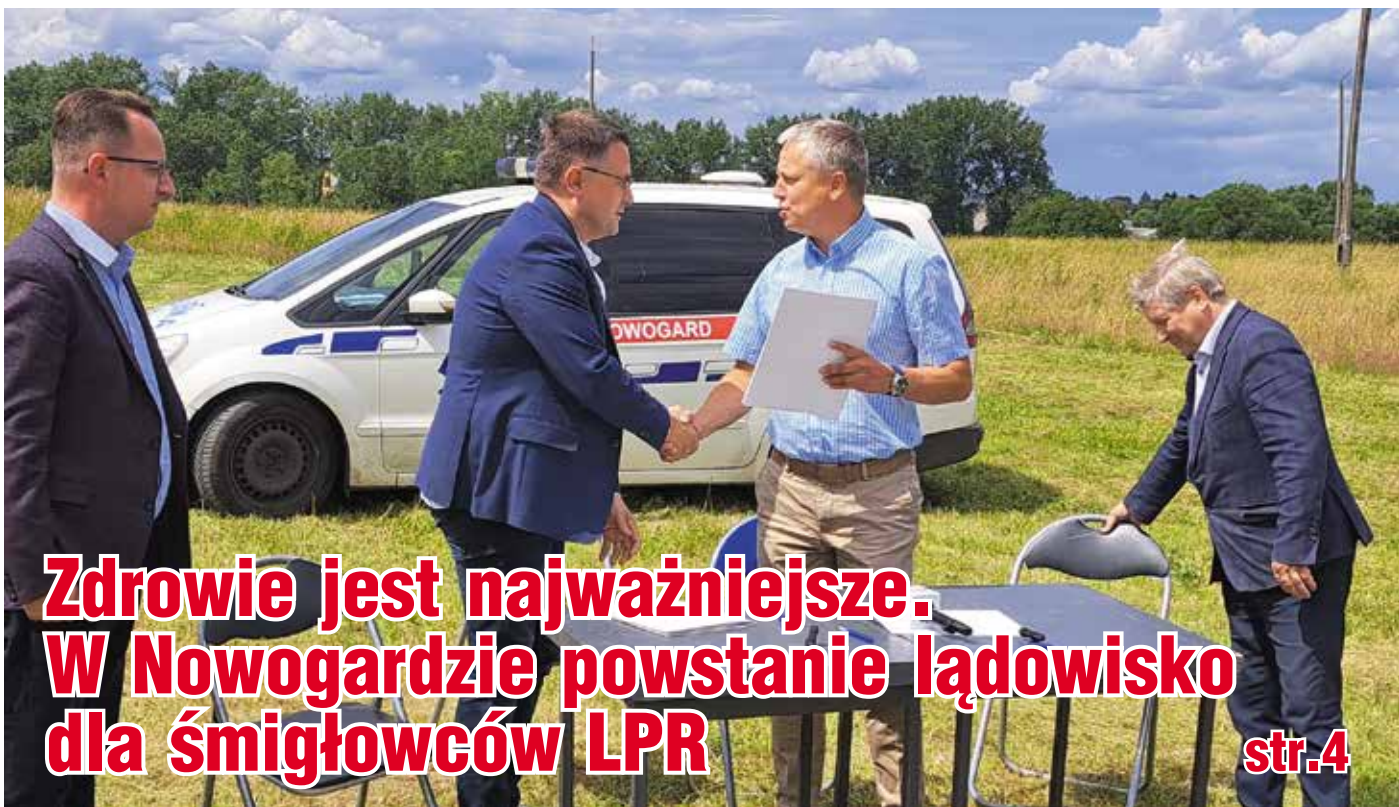
Zdrowie jest najważniejsze. W Nowogardzie powstanie lądowisko dla śmigłowców LPR