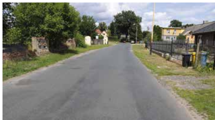
Burmistrz podpisał list intencyjny w sprawie budowy drogi w Kulicach