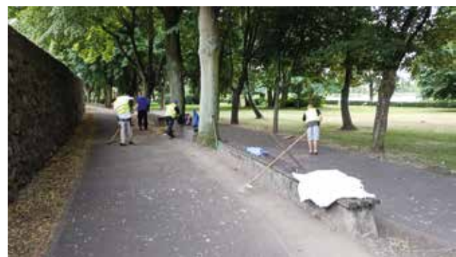
Prace porządkowe na stadionie, hakanie obrzeży chodników, krawężników na parkingu