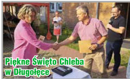
Piękne Święto Chleba w Długołęce