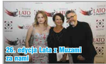
26. edycja Lata z Muzami za nami